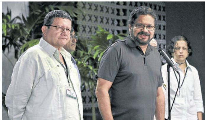
En La Habana. Luciano Marín Arango (cen.), alias Iván Márquez, y el guerrillero Jorge Torres Victoria (izq.), alias Pablo Catatumbo.

TIEMPO DE LECTURA: 5' 4" NO. DE PALABRAS: 813